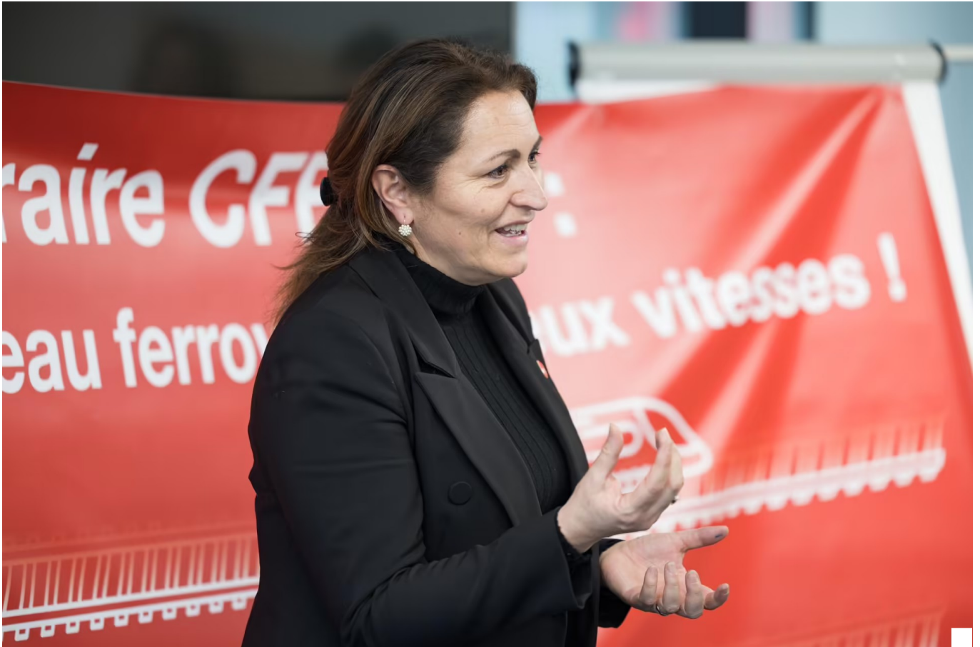
Pour la maire de Bienne, Glenda Gonzalez Bassi, la cohésion nationale est mise à mal par le nouvel horaire.

Lire aussi: Un rapport sur la gare de Lausanne pointe un manque de dialogue et des divergences entre la Confédération et les CFF